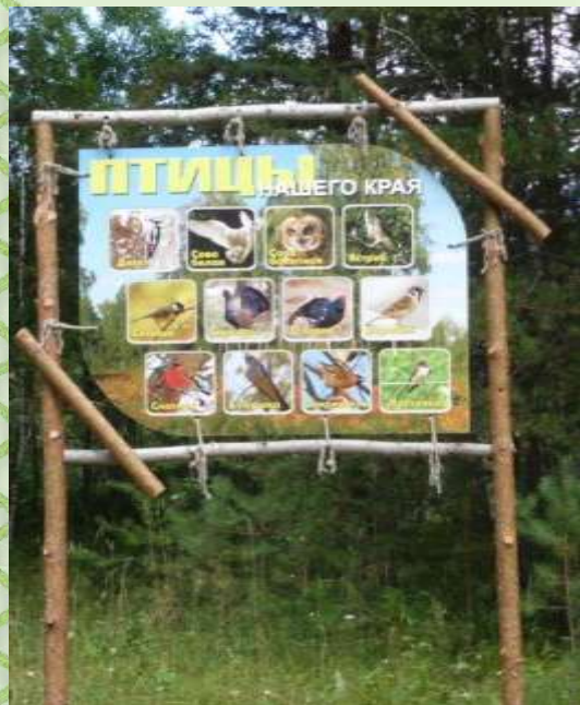
Учебный стенд «Птицы нашего края»