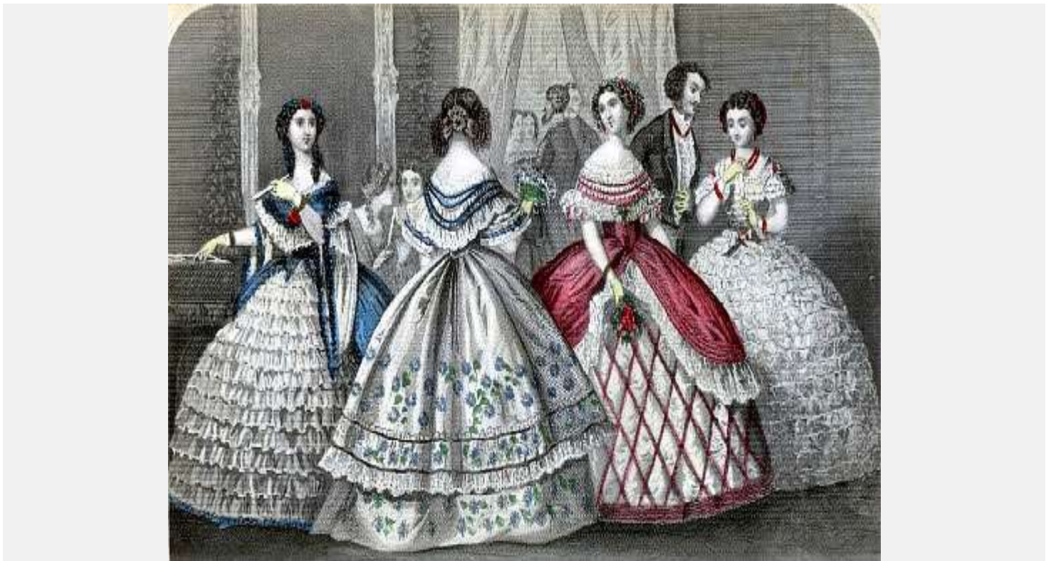
Модницы XIX века.

К 1870 году появились «турнюры» – подушки, которые укладывали под платье со стороны спины ниже талии. Сверху его украшали различными лентами. Ширина женских нарядов становится огромной, в них с трудом проходили в дверь. Поэтому каркас изделия стали делать складывающимся.