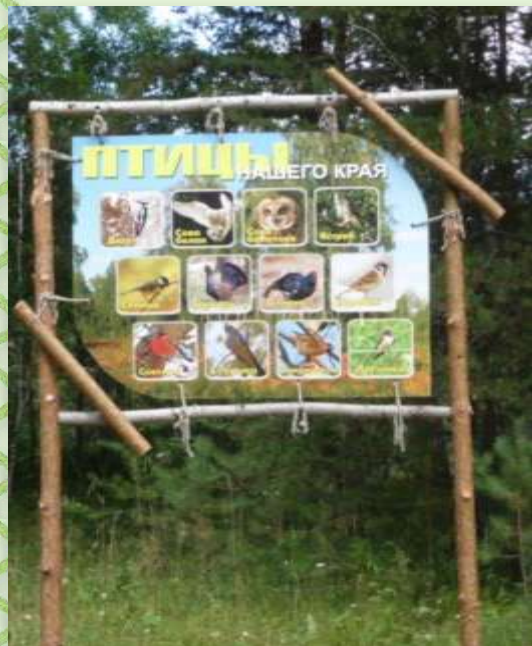
Учебный стенд «Птицы нашего края»